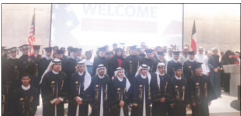
الخريجون في لقطة جماعية