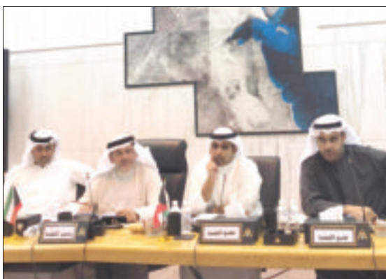
جانبا من اجتماع لجنة العاصمة