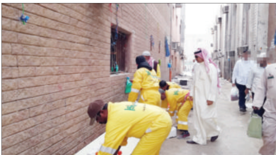
إزالة سوق عشوائية