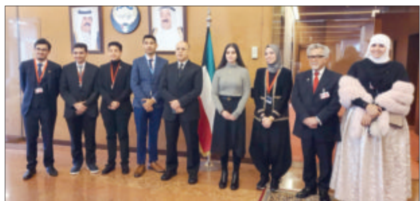
الغنيمة متوسماً الوفد الطلابي

جنيف - كونا - شاركت مجموعة من ستة شباب كويتيين من الجامعة الأميركية بالكويت «AUK»، في فعالية الأمم المتحدة بمحاكاة منظومة عمل المنظمة الاممية في جنيف، بين 29 نوفمبر الماضي والثاني من ديسمبر الجاري.