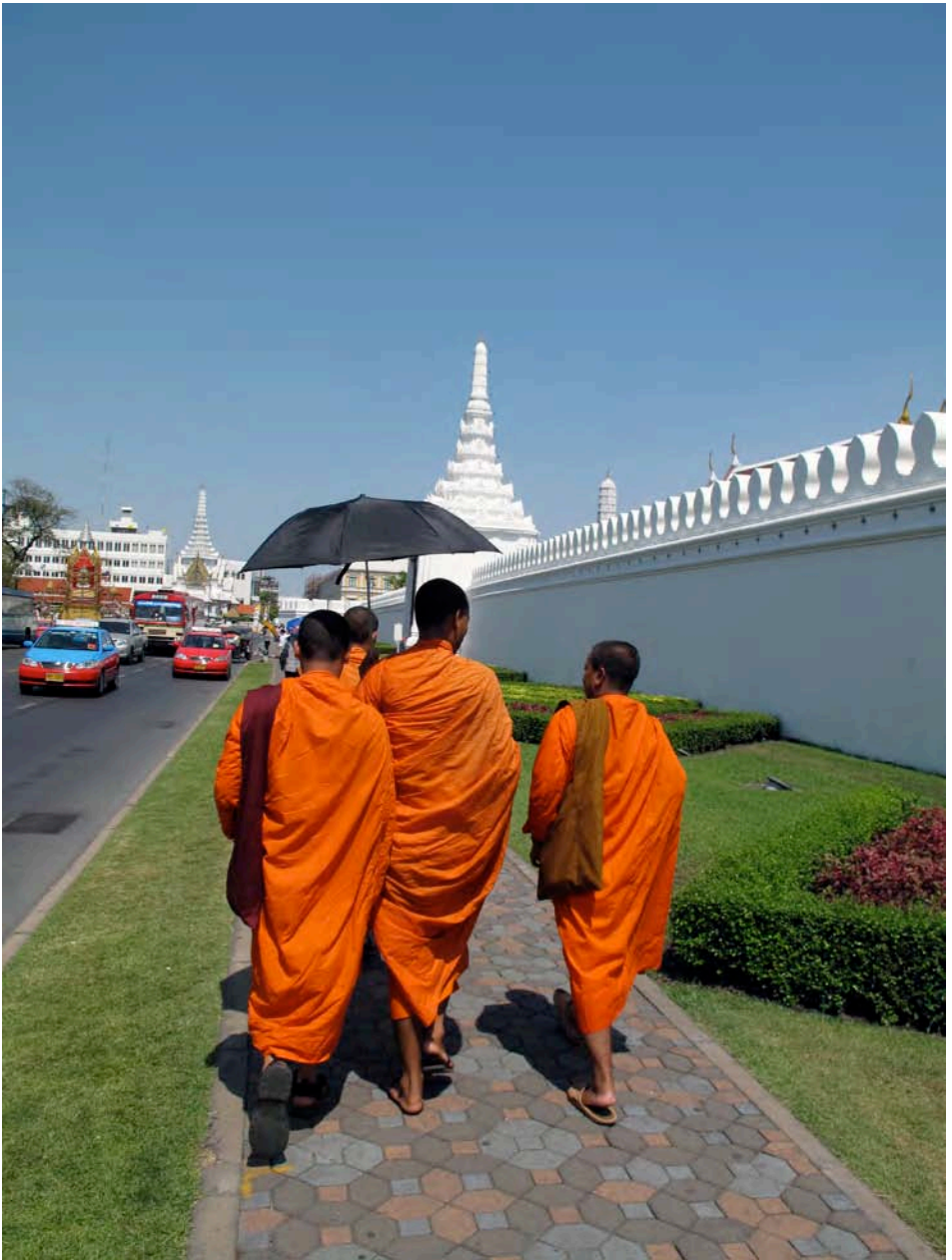
Name: William Andersen Title: Bangkok Street