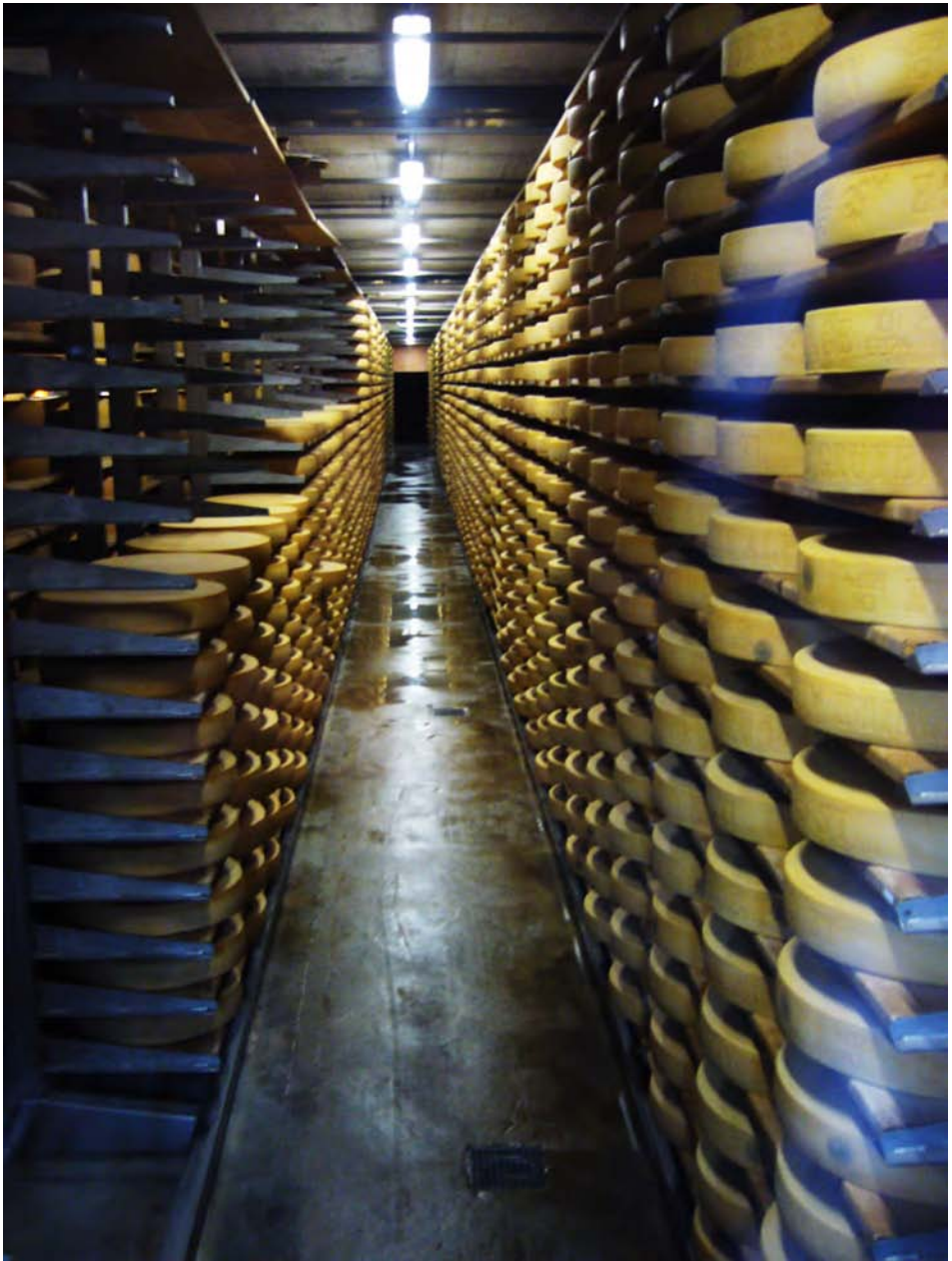
Name: Ghaneema Al-Qudmani Title: Cheese Factory