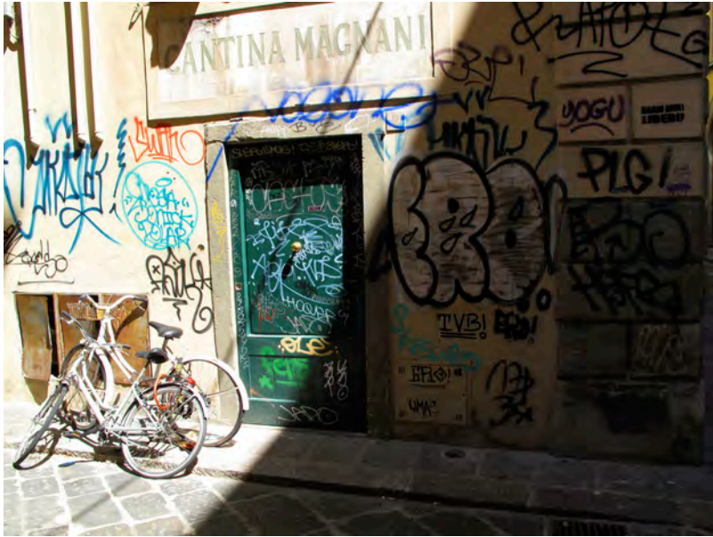
Name: William Andersen Title: Street in Florence