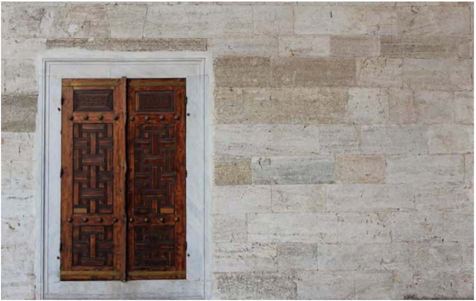
Name: Jena Al-Awadbi Title: Blue Mosque-Turkey