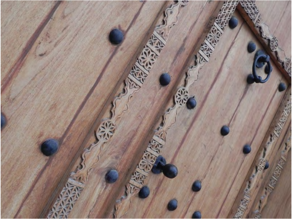
Name: Ghadeer Al Mirza Title: Untitled